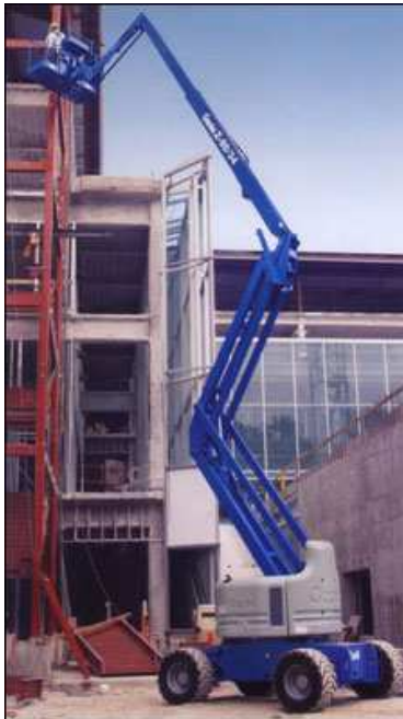
COURBE DE TRAVAIL Z™-60/34